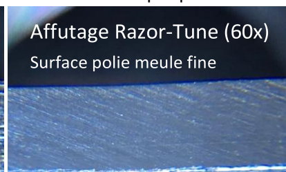
Affutage Razor-Tune (60x) Surface polie meule fine